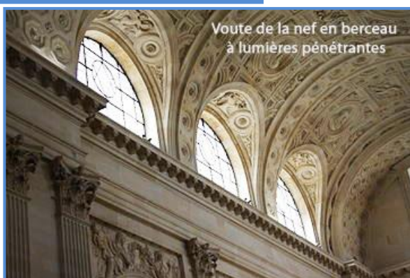
Voûte de la nef en berceau à lumières pénétrantes