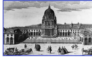
1645-1667 Construction du Val-de-Grâce