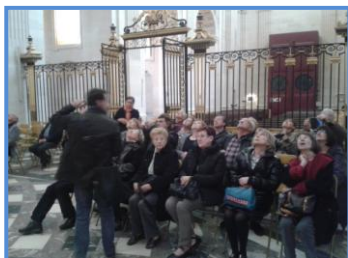
guerre à utiliser l'abbaye hôpital militaire, ce qui la