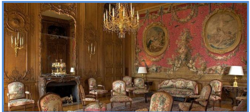
A l'étage subsiste une série de pièces en enfilade, dont le boudoir de Marie-Antoinette orné de boiseries peintes, de style rocaille.

Le Grand Salon abrite de magnifiques fauteuils en damas jaune et des boiseries décorées à l'esprit naturaliste. La Salle du Conseil est ornée de tapisseries des Gobelins. Les fauteuils Louis XV sont tendus de tapisseries de Beauvais représentant les fables de La Fontaine